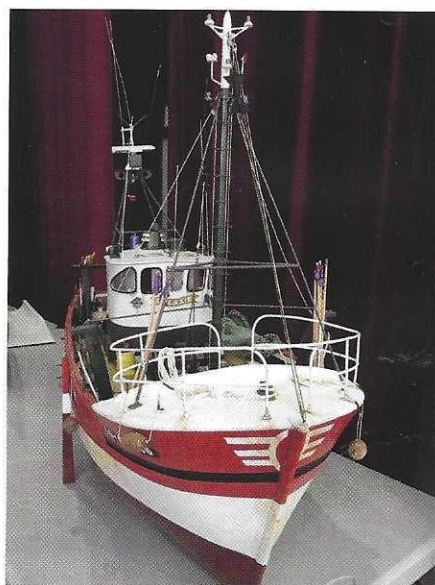
Le Galaxie (plan MRB).