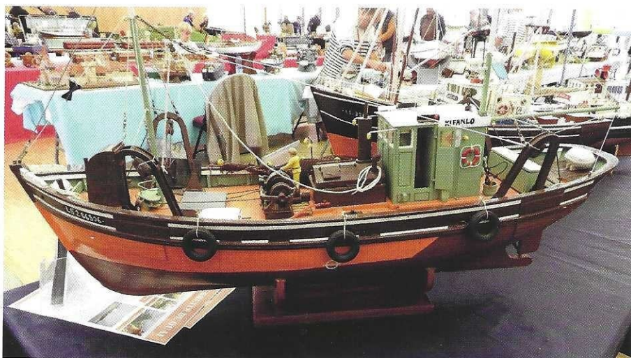
Le chalutier Kifanlo , incontournable lorsque l'on présente des bateaux vendéens.