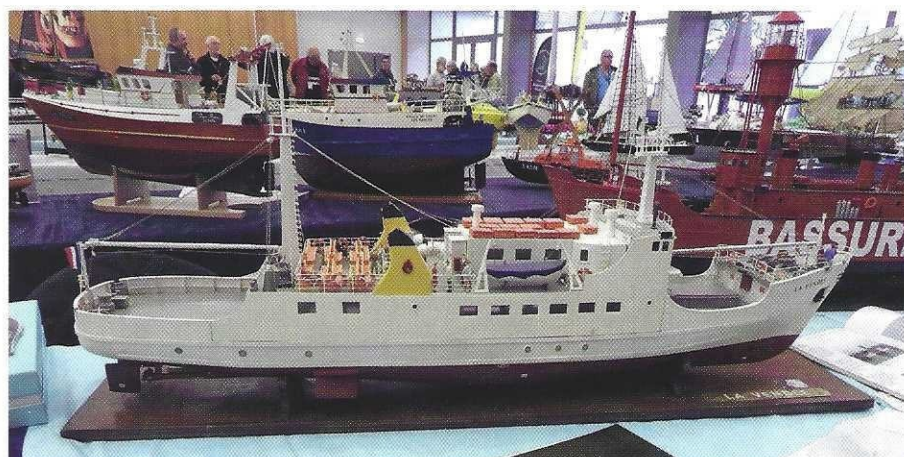
Le ferry La Vendée construit en 1969 à Lorient.