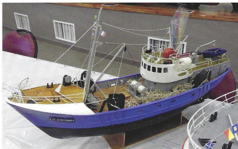
Chalutier de pêche latérale, le Lysiane Yvon .