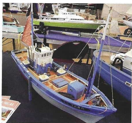
Le thonier Sans Atout .