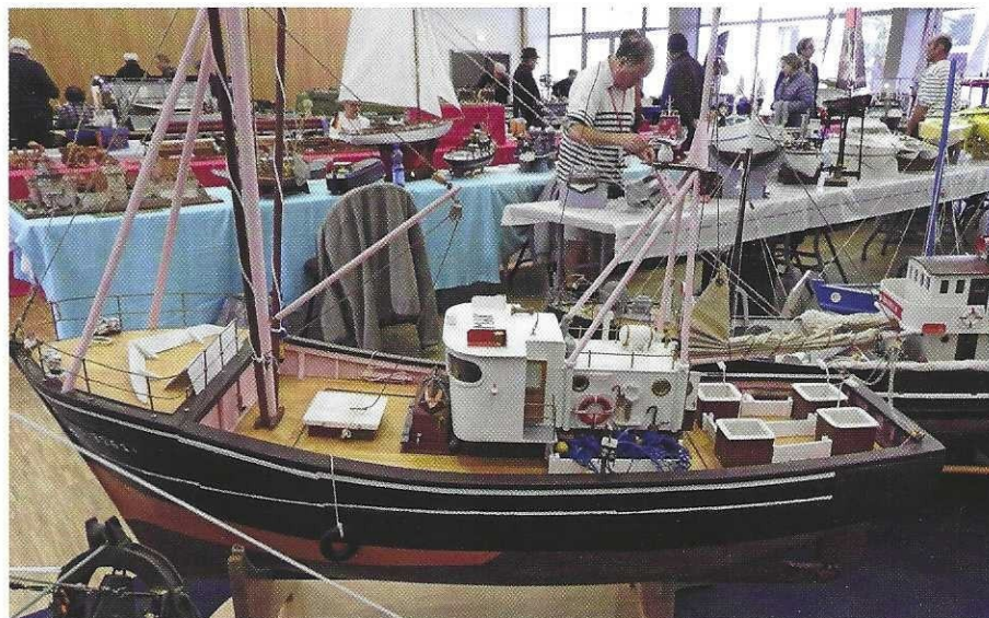
Le thonier Outsider utilisé dans les années quatre-vingt.

Cette année encore, les habitants de la région ont répondu présent : plus de 1000 visiteurs ont pu s'émerveiller